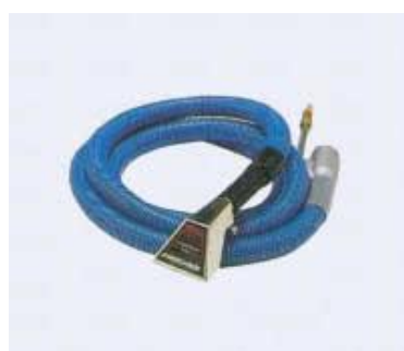
スチームマイティ用マジックウォンド